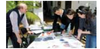
Bei der Arbeit: Die Mitarbeiter der Arnoldsche Art Publishers sind Spezialisten für verschiedene kreative Bereiche. (18)

gemeinsamen Anzeigenteil. So lassen sich Kosten sparen, moderne Techniken anwenden und die Vielfalt erhalten. Einen Überblick über die Verlagslandschaft gibt der jährlich von der Wirtschaftsförderung Region Stuttgart publizierte Wegweiser mit den Verlagen aus der Region, der auf der Frankfurter Buchmesse verteilt wird. Einen Einblick bekommt man bei den Stuttgarter Buchwochen – einer der größten regionalen Buchausstellungen Deutschlands. Um ihre Bücher , Zeitungen und Zeitschriften drucken zu lassen, haben die Verlage die Qual der Wahl: In der Region Stuttgart gibt es weit über 1.000 hervorragende Druckereien. Die Papierfabrik Scheufelen GmbH + Co. KG ist innovativ aus Tradition: In der 1773 gegründeten Papiermühle, seit 1855 ununterbrochen geführt von der Familie Scheufelen, entwickeln Meister der Papiermacherskunst ganz besondere Papiere – für die Vatikanische Bibliothek, für mehrere Flüge zum Mond und für die Casinos von Las Vegas. Ein Druckhaus für spezielle Aufträge ist außerdem die Dr. Cantz'sche Druckerei, die als erste Adresse für Künstler gilt.