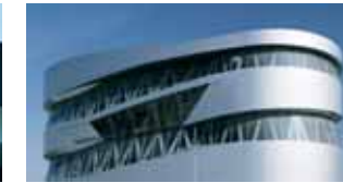
Faszinierende Fahrzeugtechnik: Das Mercedes-Benz-Museum zeigt die bewegte Geschichte des Automobils. (11)