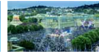
Im Fußballtaumel: Über 1,5 Millionen Menschen sahen WM-Spiele auf dem Stuttgarter Schlossplatz. (5)