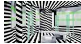
Ist gerne verrückt: Die Madness GmbH aus Göppingen ist eine Full-Service-Agentur im Bereich 3D mit Schwerpunkt Informationsdesign. (22)