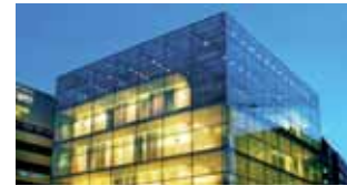
Bedeutendste Otto-Dix-Sammlung: Der gläserne Würfel auf dem Stuttgarter Schlossplatz beherbergt das Kunstmuseum. (4)