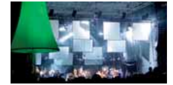
Präsentationen und Podiumsdiskussionen: Die Stuttgarter Medientage zeigen einen Querschnitt der regionalen Medienlandschaft. (9)

Arbeit ein. Kritischer Trendscout und risikobereiter Vorausdenker ist seit langem der Deutsche Werkbund Baden-Württemberg. Sein Ziel ist es, der vom Menschen geschaffenen Umwelt eine humane Gestaltung zu geben. Er bemüht sich um die Aufbereitung fachübergreifender und zeitrelevanter Probleme und wirkt durch zahlreiche Veranstaltungen und Publikationen an deren Lösung mit. Das „Werkbund Label“ vergab er 2006 erstmals für Projekte und Initiativen, die sich durch herausragende innovative oder gestalterische Qualität und soziale oder politische Vorbildfunktion auszeichnen. Einen Einblick in die vielfältige Medienlandschaft bekommt man bei den Stuttgarter Medientagen. Als Musikmesse etabliert sich die Suedtonale, die Tonträgerhersteller, Musikverlage und Musikproduzenten in Bayern und Baden-Württemberg anspricht. Einen Besuch wert ist außerdem die Neue Messe Stuttgart, die im September 2007 ihre Pforten öffnet.