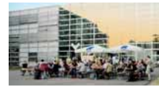
Kunst an der Basis: Was junge Künstler anregt und umtreibt, zeigt die Sommerausstellung der Staatlichen Akademie der Bildenden Künste Stuttgart. (28)