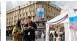
Action in den Stuttgarter Innenstadtkinos: Das Internationale Trickfilm-Festival Stuttgart (ITFS) lockt mit herausragenden Wettbewerbsfilmen. (14)