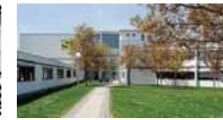
Virtueller Unternehmensverbund: Im Softwarezentrum Böblingen/Sindelfingen e.V. arbeiten rund 80 Software-Unternehmen zusammen. (23)