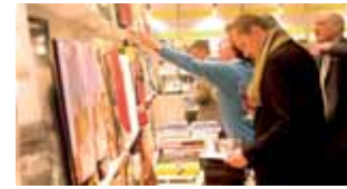
Eine der größten regionalen Buchausstellungen Deutschlands: Die Stuttgarter Buchwochen ziehen jedes Jahr mehr als 110.000 Besucher an. (16)