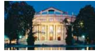
Zauberhafte Klänge und fantastische Ballettaufführungen: Das Stuttgarter Opernhaus wurde fünf Mal hintereinander zum Opernhaus des Jahres gewählt. (1)