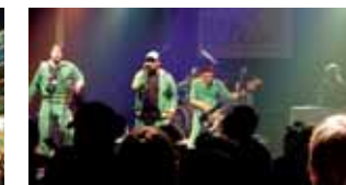
Fördert neue Businessmodelle, junge Macher und jugendliche Nachwuchsmusiker: Das Popbüro Region Stuttgart bietet Beratung rund um die Musik. (21)