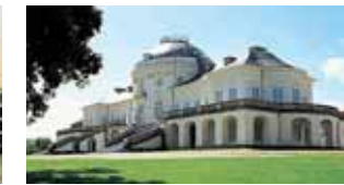
Inspirationsgeber: Die Akademie Schloss Solitude ist ein Ort für den wissenschaftlichen und künstlerischen Austausch. (29)