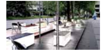
Hohe Clubdichte: In der Stuttgarter Theodor-Heuss-Straße haben Partygänger die Qual der Wahl. (6)

der Region nicht unerwähnt bleiben. Denn auch ein guter Tropfen fördert die Kreativität. Diese Broschüre kann und will keinen vollständigen Überblick über alle kreativen Angebote in der Region Stuttgart geben. Aber sie liefert einen Einblick in die Vielfalt, in die Innovations- und Leistungsfähigkeit des Standorts. Für alle Fragen sind wir – die Herausgeber der Broschüre – stets für Sie da. Die Landeshauptstadt Stuttgart bietet mit einem Medienteam, die Stadt Ludwigsburg mit einem Medienbeauftragten Kompetenz in allen Fragen der Medienwirtschaft. Für die Recherche nach Adressen, Produkten und Dienstleistungen gibt es bei der IHK Region Stuttgart eine Datenbank der Medien- und Kommunikationswirtschaft und für Innovative aller Branchen sowie Existenzgründer umfassende Beratung und Unterstützung. Mit der MedienInitiative Region Stuttgart – dem Netzwerk der Macher – entwickelt die Wirtschaftsförderung Region Stuttgart neue Projekte und bietet Informationen und Kontakte. Die MFG Baden-Württemberg – das Medienkompetenzzentrum des Landes – fördert den Standort in den Bereichen Informationstechnologie, Medien und Film.