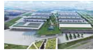
Mehr Umsatz, mehr Arbeitsplätze, mehr Internationalität: Die Neue Messe Stuttgart sorgt für einen deutliche Ausstrahlung. (7)