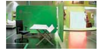
Zukunftsweisende Gestaltungsleistungen: Der internationale Designpreis wird jährlich vom Design Center Stuttgart verliehen. (12)

Fragen zu den verschiedensten Gestaltungsdisziplinen. Sein Auftrag ist Wirtschaftsförderung in dem Sinne, dass es kleinen und mittleren Unternehmen Orientierung gibt, wenn sie ihre Produktentwicklung und den gesamten Unternehmensauftritt verbessern wollen. Das Design Center vergibt den Internationalen Designpreis Baden-Württemberg für Profis sowie den Mia-Seeger-Preis für Nachwuchs-Designer. Die internationale Konferenz „Face to Face“ ist eine der renommiertesten Grafikdesignveranstaltungen im deutschsprachigen Raum. In vielen weiteren Ausstellungen, Vorträgen und Workshops greift das Design Center Stuttgart aktuelle Gestaltungsthemen auf. Herausragend ist beispielsweise die Reihe „Management und Design“, die zeigt, dass auch Design eine Managementaufgabe ist und nur dann zum Erfolgsfaktor wird, wenn es enger Bestandteil der strategischen Ausrichtung von Unternehmen ist.