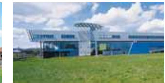
Medien-Rundum-Genie: Europaweit deckt die Hochschule der Medien (HdM) als einzige Hochschule alle Medienbereiche ab. (30)

deckt sie als einzige Hochschule alle Medienbereiche ab. Ihre Bandbreite erstreckt sich vom Druck bis zum Internet, von der Gestaltung bis zur Betriebswirtschaft, von der Bibliothekswissenschaft bis zur Werbung, von Inhalten für Medien bis zur Verpackungstechnik, von der Informatik über die Informationswissenschaft bis zum Verlagswesen und zu elektronischen Medien. Insgesamt 17 Studiengänge spiegeln diese Inhalte wider. Mit jährlich mehr als 10.000 neu abgeschlossenen Lehrverträgen leistet die gewerbliche Wirtschaft einen wichtigen Beitrag für die duale Ausbildung in der Region Stuttgart. Um die beruflichen Perspektiven junger Menschen weiter zu verbessern, kooperieren inzwischen immer mehr Betriebe mit Schulen. In Praxisprojekten, neuerdings auch in Ganztagschulen, erfahren Schüler Wissenswertes über die Arbeitswelt.