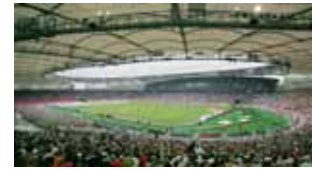
Weltweit bekannt für seine Dächer und Brücken: Auch das Dach des Stuttgarter Gottlieb-Daimler-Stadions wurde von Ingenieur Jörg Schlaich geplant. (25)

Bund Deutscher Architekten (BDA) www.bda-architekten.de