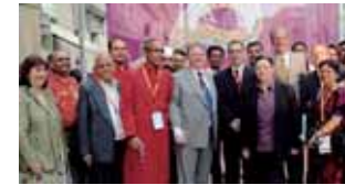
„Bollywood and Beyond“ ist das einzige Filmfestival in Deutschland, das ausschließlich dem indischen Film gewidmet ist. (13)