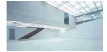
Stadthaus im Scharnhäuser Park in Ostfildern: Das Neubaugebiet auf den Fildern ist ein ökologisch vorbildlicher, familienfreundlicher Wohn- und Lebensraum. (27)

Vielzahl von Türmen in aller Welt. Die Stuttgarter Markthalle im Jugendstil ist eine der schönsten in Deutschland - von Martin Elsässer gebaut und 1914 eingeweiht. Die Stuttgarter Weissenhofsiedlung von 1927 ist eines der wichtigsten Zeugnisse des Neuen Bauens, ein zukunftsweisendes Modell für das Wohnen des Großstadt-menschen. Das bekannteste Gebäude der Weissenhofsiedlung ist das Doppelhaus von Pierre Jeanneret und Le Corbusier – dessen internationales Werk in die Unesco-Weltkulturerbeliste aufgenommen werden soll. Es beherbergt das Weissenhofmuseum, ein „begehbare Exponat“ für Architekturinteressierte. Da von den 21 Bauten der Weissenhofsiedlung heute nur noch elf erhalten sind, wurden die anderen dank des Informationssystems „Weissenhof Digital“ virtuell erlebbar.