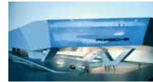
Treibstoff für die Fahrzeuge der Zukunft: Porsche zählt zu den innovativsten und wirtschaftlich stärksten Automobilherstellern der Welt. (10)