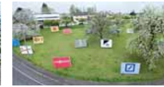
Prägte das visuelle Erscheinungsbild Deutschlands: Das Gesamtwerk von Anton Stankowski beeindruckt durch seine mediale Vielfalt. (8)