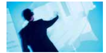
Produktdesign im Virtuellen Raum: Im Cave des Höchstleistungsrechenzentrums der Universität Stuttgart entwerfen Computer eine Turbinenschaufel. (24)

führend ist, sondern auch bleibt, sichert sie den Nachwuchs. IT-Forschung und -Lehre werden hier groß geschrieben. Das Fraunhofer Institut für Arbeitswirtschaft und Organisation (IAO) sorgt mit mehreren hundert Beschäftigten für den wirksamen Wissenstransfer von der Wissenschaft in die Wirtschaft. Es gibt zwei Universitäten und neun Fachhochschulen, die für eine hervorragende Ausbildung sorgen. Die Fakultät für Informatik, Elektrotechnik und Informationstechnik der Universität Stuttgart genießt beispielsweise eine außerordentliche Reputation. Jährlich kommen Tausende von erstklassigen Absolventen auf den Arbeitsmarkt. Ihre Beschäftigungschancen sind ausgezeichnet. Die GMA-Studie zeigt, dass fast ein Drittel der befragten IT-Unternehmen in diesem Jahr neue Stellen schaffen will, zwei Drittel wollen den Personalstand zumindest halten.