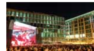
Gelungene Mischung aus Jazz, Blues oder auch Ethnopop: Jährlich im Juli versammeln sich bei den BW-Bank Jazzopen Stuttgart die Jazz-Größen der Welt. (20)