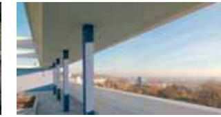
Blick vom Haus Le Corbusier in der Stuttgarter Weissenhofsiedlung: Sie ist ein zukunftsweisendes Modell für das Wohnen des Großstadtmenschen. (26)