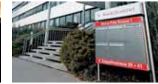
Wegweisend: Mit Reiseführern wie Marco Polo und Lonely Planet oder den Falk-Stadtplänen zeigt die MairDumont GmbH & Co. KG, wo es langgeht. (17)