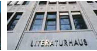
Vielfältiges Programm: Das Literaturhaus Stuttgart ist ein lebendiger Treffpunkt für alle Literaturinteressierten. (2)