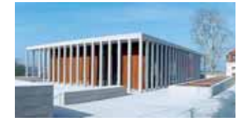
Verführt zur Literatur: Das Literaturarchiv der Moderne (LiMO) lockt mit Werken des 20. und 21. Jahrhunderts. (3)

die Nähe zu Kunden, Zulieferern, Hochschulen und Forschungseinrichtungen sowie die Kooperationsmöglichkeiten mit anderen Unternehmen. Auch die Qualifikation und Verfügbarkeit von Personal sowie die gute Verkehrsanbindung erhielten gute Noten. Ganz besonders heben die kreativen Unternehmen die Freizeit-, Kultur- und Gastronomieangebote hervor. Diese weichen Faktoren treten bei der Standortwahl zunehmend in den Vordergrund. Dass sich die Kreativwirtschaft in und um Stuttgart so gut entwickelt, ist also auch den bedeutenden Kulturinstituten, Theatern, Museen und Clubs zu verdanken, von denen wir hier nur einige beispielhaft erwähnen können. Aus dem Kulturleben nicht wegzudenken ist das Staatstheater Stuttgart, das Schauspiel, Oper und Ballett auf höchstem Niveau bietet und Deutschlands größtes Dreispartenhaus ist. Fünf Mal hintereinander wurde es zum Opernhaus des Jahres gewählt – ein einmaliger Rekord. Ein künstlerisches Highlight von besonderer Anziehungskraft sind die jährlichen Ludwigsburger Schlossfestspiele. Auf hohem Niveau präsentiert sich ebenfalls das Kunstmuseum Stuttgart mit dem weltweit größten Werkbestand von Otto Dix . Eine der bedeutendsten Literaturinstitutionen weltweit ist das Deutsche Literaturarchiv Marbach (DLA).