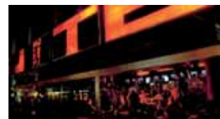
Live-Musik in der Stuttgarter Bar „Suite“: Egal ob Klassik, Jazz, HipHop, Rock, Pop oder Soul – Stuttgart schwelgt im Sound. (19)