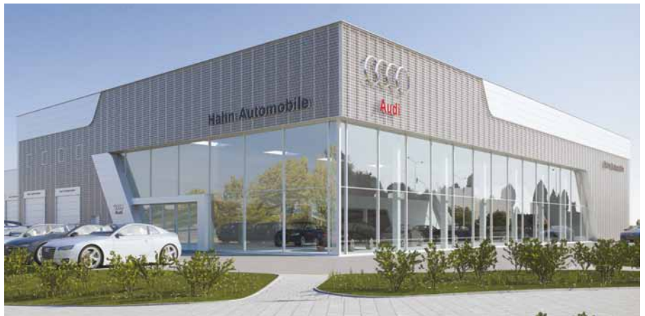
Im neuen Audi-Terminal sollen künftig 850 Neuwagen und 900 Gebrauchtwagen pro Jahr verkauft werden.